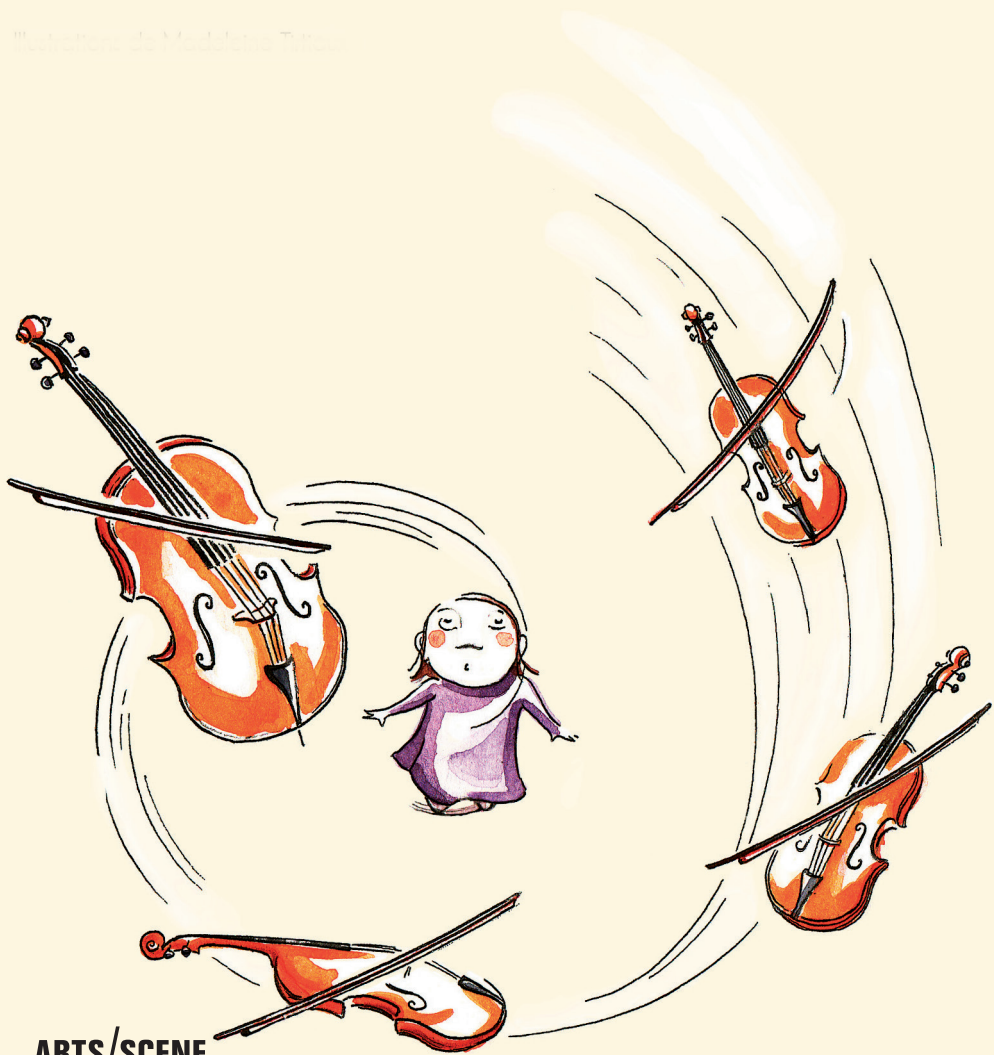
Illustration de Madeleine Tiriaux