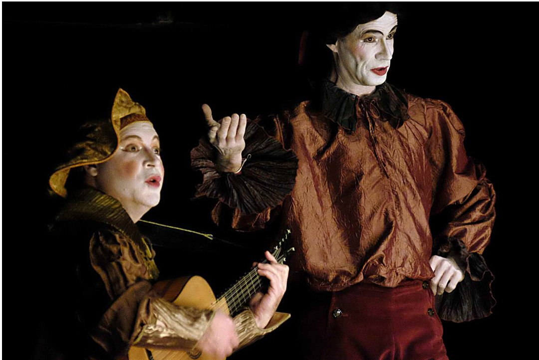
Les Fables au bout des doigts