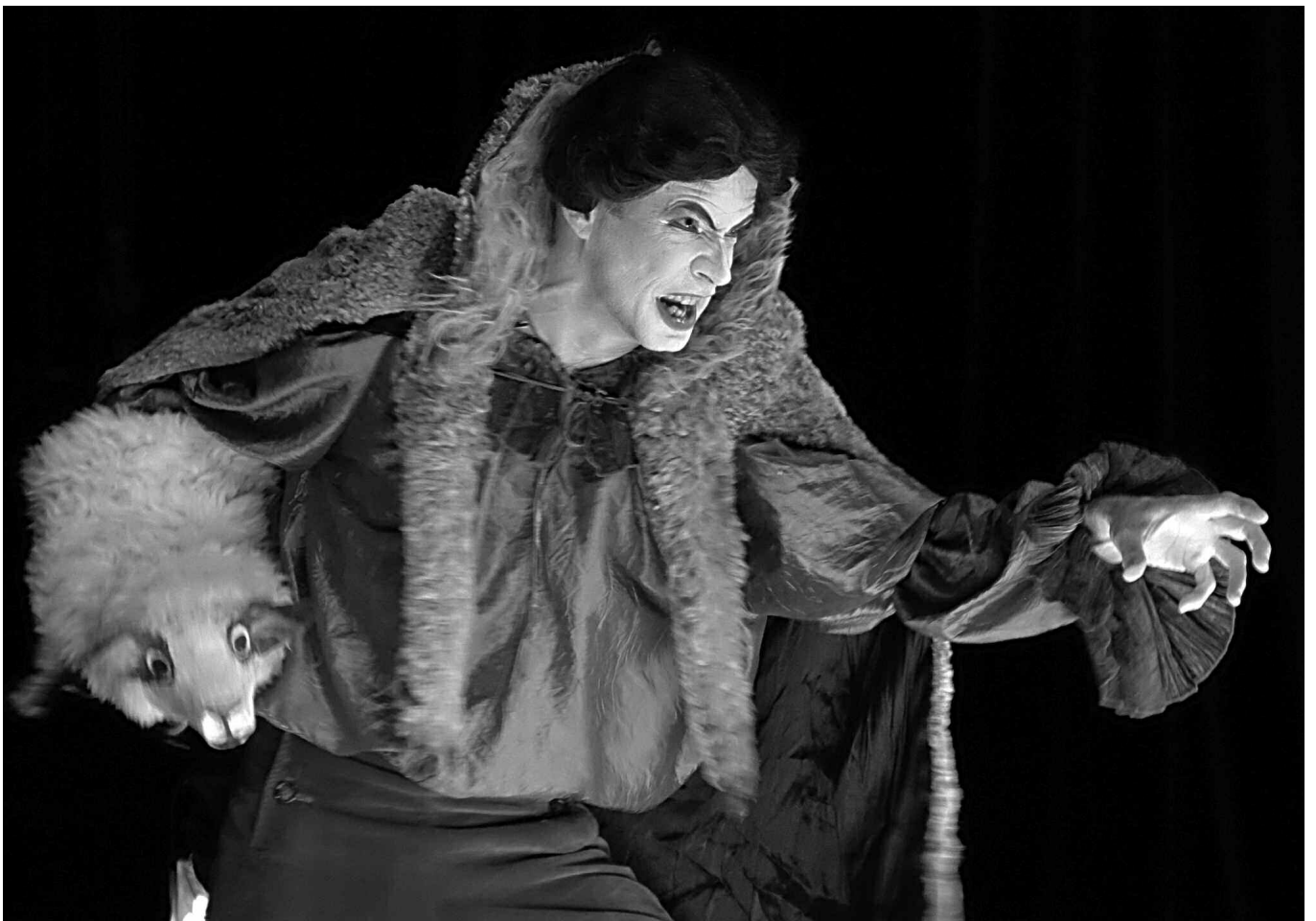
Le Loup et l'agneau, La Fontaine