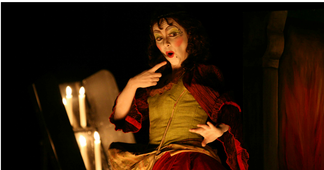
Perrault, Contes baroques