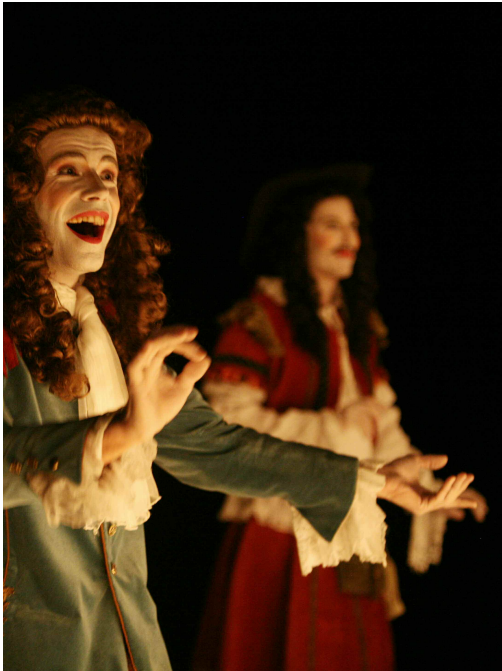
Les Fâcheux, Molière