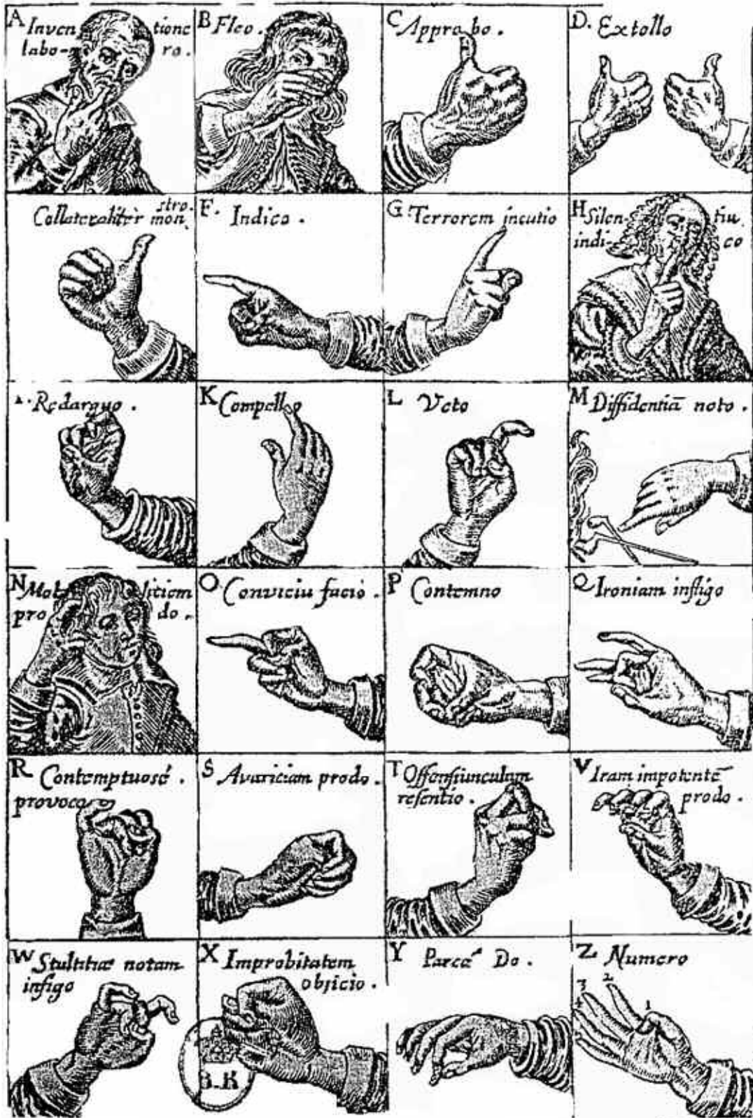
Planche de chirologie : gestes des doigts John Bulwer, 1ère édition 1644