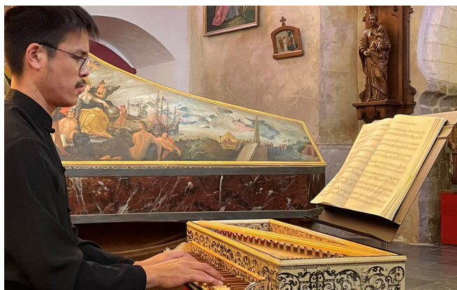
Figure majeure de l'histoire du clavier, au même titre que Bach et Chopin, Jan Pieterszoon Sweelinck (1562-1621) est surnommé à l'aube du XVII e siècle « le Phénix de la musique » ou encore « le Prince des musiciens ». Reconnu pour ses talents d'improvisateur, son absolue maîtrise de l'écriture polyphonique et son expertise en facture instrumentale, l'organiste de la Oude Kerk d'Amsterdam a formé toute une génération de musiciens nord-européens. Il laisse une œuvre considérable de musique vocale et de musique pour claviers, connue de son vivant en Angleterre, en Europe centrale et en Italie.