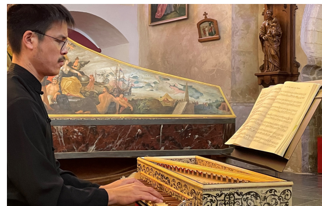
Figure majeure de l'histoire du clavier, au même titre que Bach et Chopin, Jan Pieterszoon Sweelinck (1562-1621) est surnommé à l'aube du XVII e siècle « le Phénix de la musique » ou encore « le Prince des musiciens ». Reconnu pour ses talents d'improvisateur, son absolue maîtrise de l'écriture polyphonique et son expertise en facture instrumentale, l'organiste de la Oude Kerk d'Amsterdam a formé toute une génération de musiciens nord-européens. Il laisse une œuvre considérable de musique vocale et de musique pour claviers, connue de son vivant en Angleterre, en Europe centrale et en Italie.