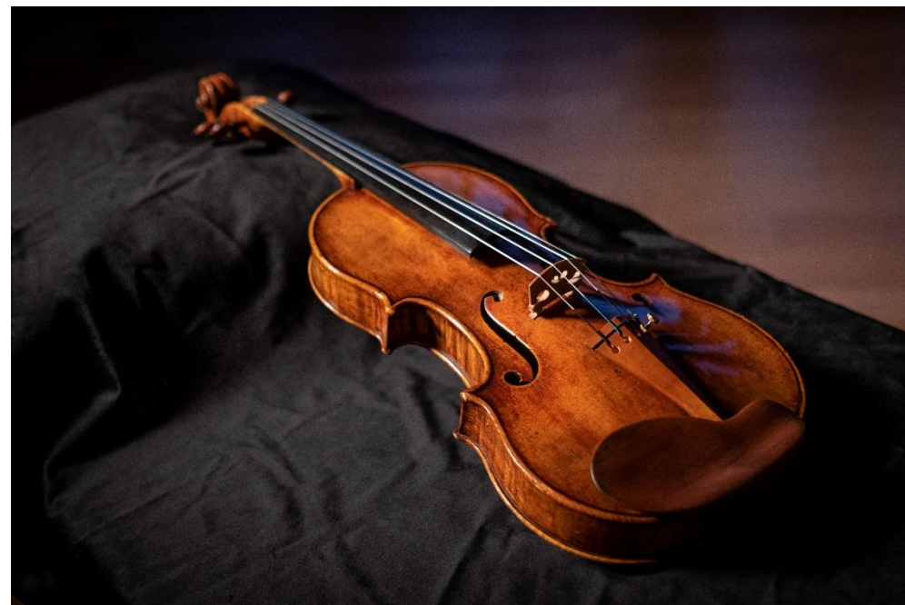
Queen Elisabeth Music Chapel