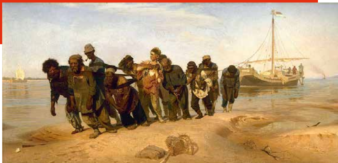
Bateliers de la Volga Ilya Repine

LA GRANDE PORTE DE KIEV HARTMANN - MOUSSORGSKI