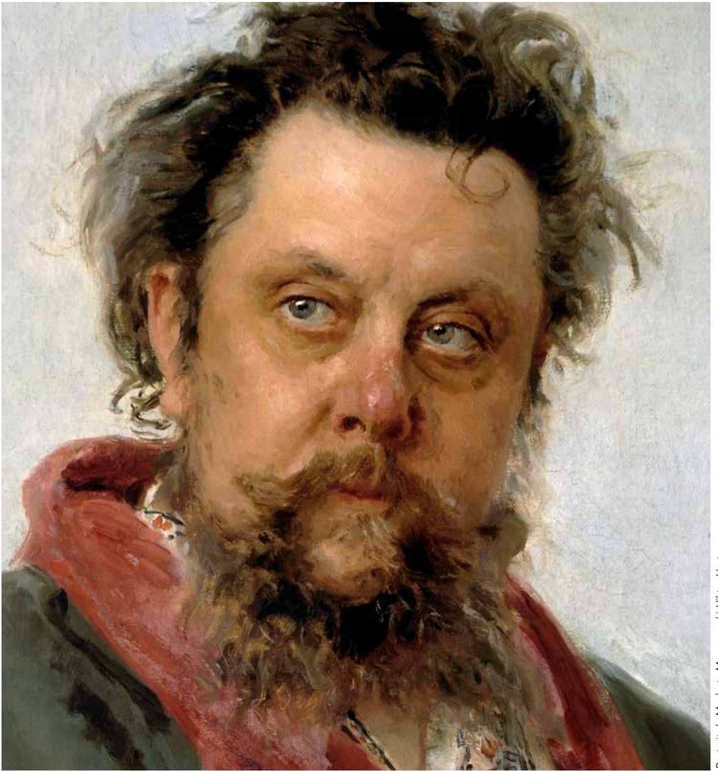
Portrait de Modeste Moussorgski, Viktor Hartmann