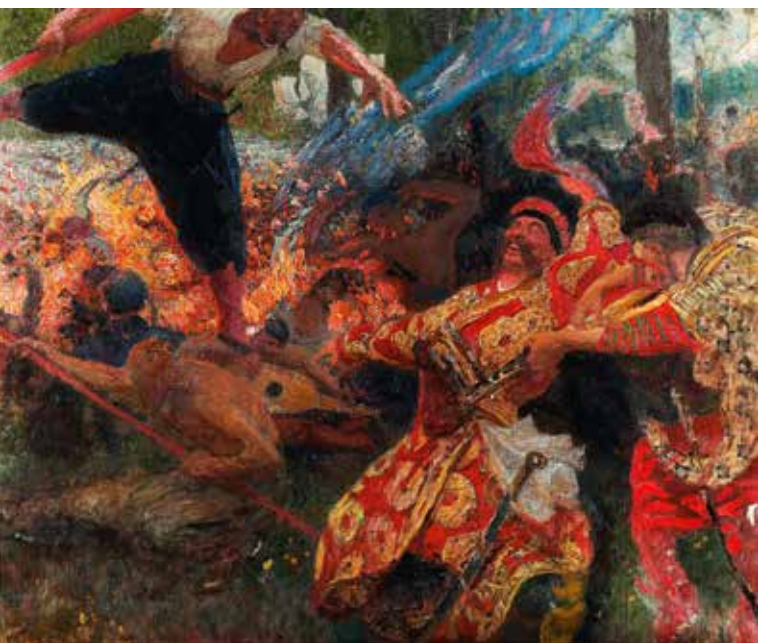
Gopak , Ilya Repine

À la manière de Vladimir Stassov qui réussit à mettre en lien ses contemporains, nous avons imaginé, avec l'arrangeur-compositeur Robin Melchior, une partition qui fasse se rencontrer et dialoguer les œuvres de Moussorgski, Hartmann et Repine. Notre idée est de partir d'une nouvelle orchestration des Tableaux d'une exposition destinée à La Symphonie de Poche et d'ajouter à l'œuvre initiale des compositions inspirées par des tableaux de Repine. Ces derniers viennent augmenter l'exposition originelle dans une œuvre inédite et composite : Tableaux d'une nouvelle exposition .